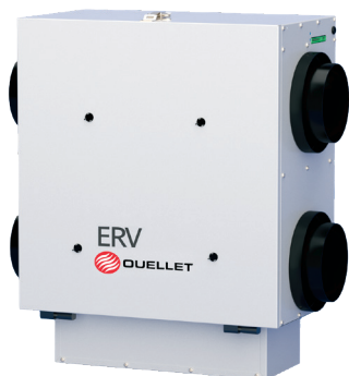
Modèle avec sorties latérales (Side Port)

VRE - Échangeur d'air récupérateur d'énergie avec recirculation