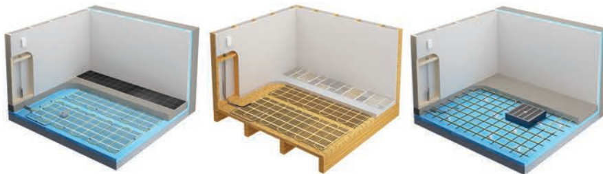
OWC-M : Installation sous une dalle de béton de 4 à 6 po